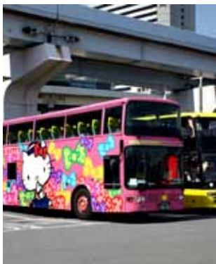
4. 行车路线 东京站丸之内南口-银座4丁目-台场