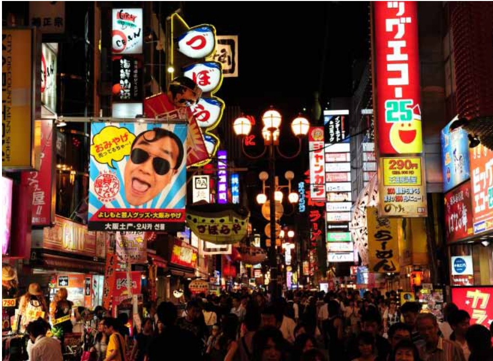
4.地址 大阪市中央区难波1丁目6-12 交通 搭乘地铁御堂筋线至难波站下，步行可达。